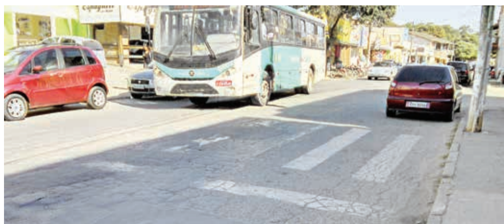
Faixa de pedestre precisa de nova pintura