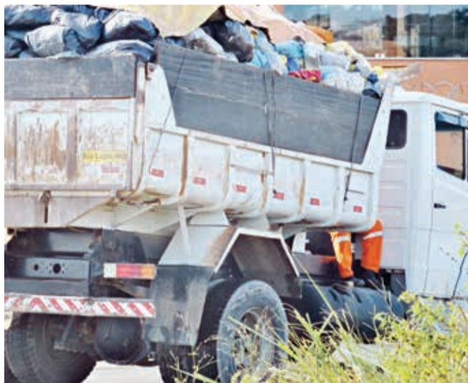
Detalhe - os coletores ficam sentados entre a cabine e a carroceria sem nenhuma proteção