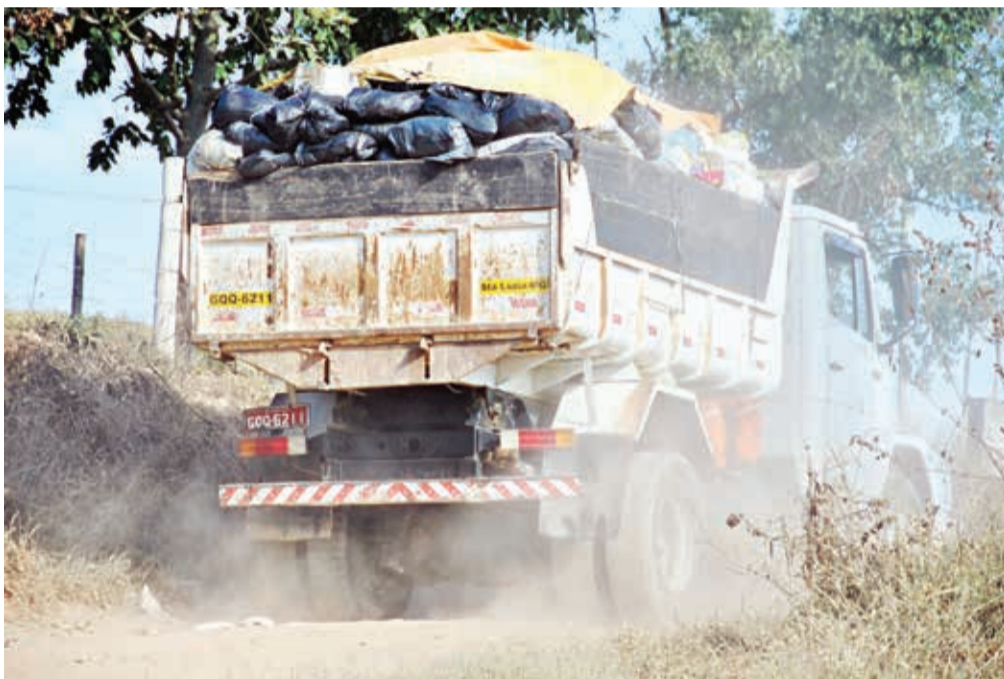
Caminhão bascula chega para pesagem na Fazenda Boa Esperança.

Essa situação inusitada tem que ter uma resposta condizente da prefeitura, caso contrário, podemos afirmar que estamos no caminho inverso. Enquanto todo o mundo avança, por aqui estamos regredindo. Um verdadeiro retrocesso.