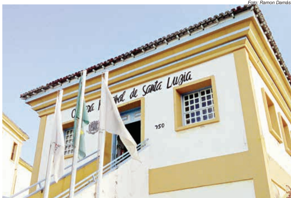
Vereadores aprovaram maioria dos projetos de autoria do prefeito

Durante os seis primeiros meses de trabalhos no legislativo, o que se viu foi uma aprovação quase que unânime dos projetos enviados pelo prefeito àquela Casa. Os vereadores que debateram e tentaram fazer oposição, foram massacrados pela maioria dos pares. Muitos discursos, pouca cobrança, nenhuma audiência pública marcada, centenas de indicações e requerimentos sem respostas, falta de atitude dos membros das comissões e a ausência do público para acompanhar as reuniões, agora noturnas. Esse é o retrato da atual Câmara Mu-