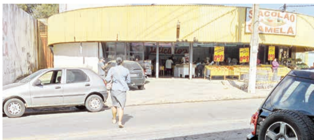
Essa senhora esperou um bom tempo até conseguir atravessar