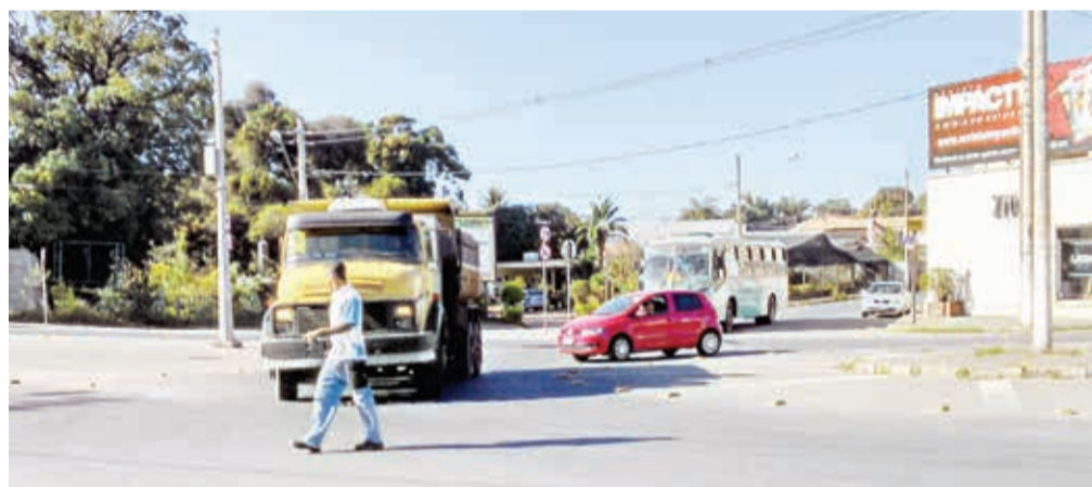
Pedestre arrisca e atravessa na frente do caminhão