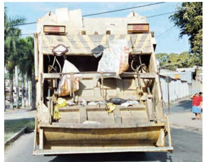
Caminhões prensa são minoria na cidade

REIS ELETROSAT REVENDEDOR AUTORIZADO SKY