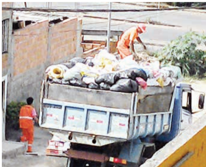
Flagrante - coletor arrisca a vida em cima do lixo em caminhão bascula - impróprio para o serviço