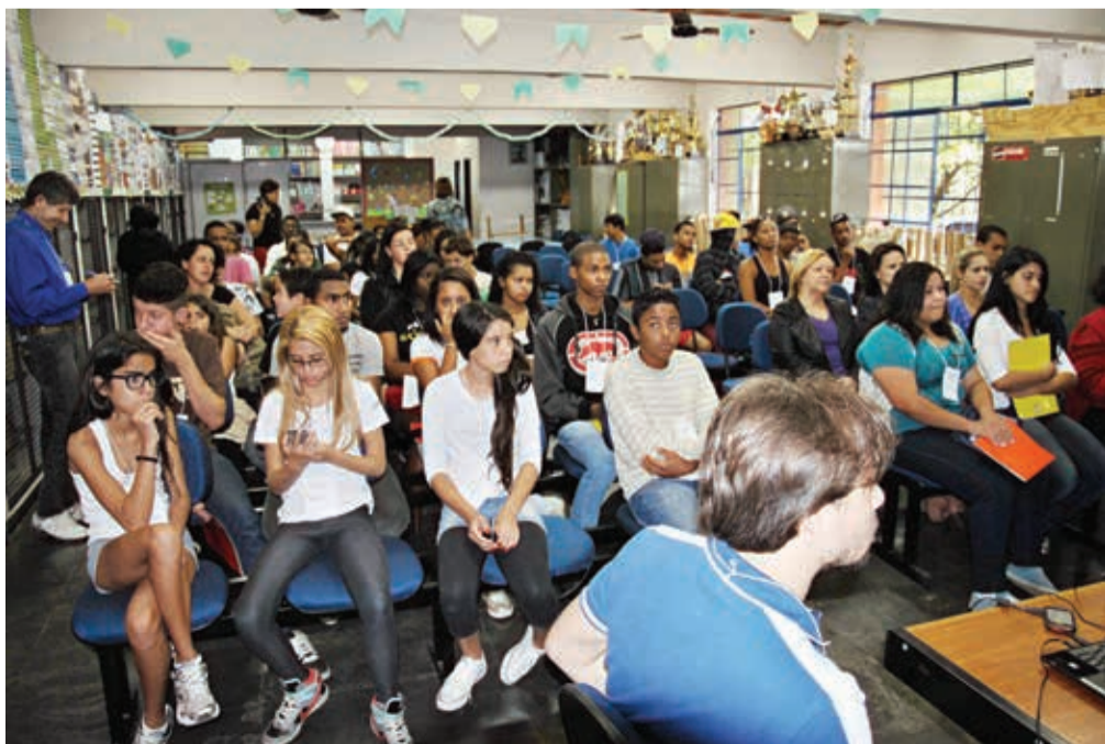
Os jovens compareceram, mas os políticos de Santa Luzia não

Divididos em grupos, os jovens debateram e apontaram as principais propostas para a juventude de Santa Luzia, entre elas: Maior participação e Diálogo da juventude com a Prefeitura Municipal, criação do Conselho Municipal de Juventude, escolas estaduais abertas aos finais de semana para cursos, oficinas culturais e atividade Integral para a juventude, acompanhamento escolar disponibilizado pelo o governo, implementação do ponto municipal de convivência e referência da juventude, ampliação do Programa Fica Vivo na Cidade, entre outros.