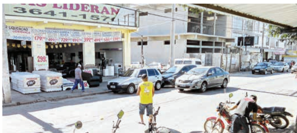
Atravessar na rua do Comércio requer sorte e paciência

A nossa reportagem permaneceu na rua do Comércio por trinta e cinco minutos e constatou que a única faixa de pedestres que está com a pintura quase toda apagada é pouco utilizada. Poucos motoristas cedem a vez e aguardam pela travessia. Muitos pedestres se arriscam em meio aos carros para conseguir chegar ao outro lado da rua fora da faixa. Enquanto isso, prevalecem a sorte e a paciência daqueles que trafegam e transitam movimentada rua do Comércio.